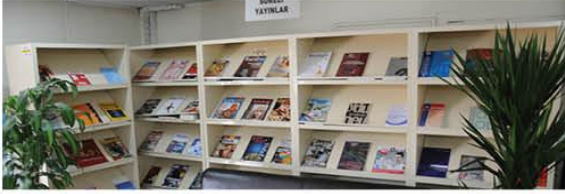
Resim 3: Sürelî Yayınlar Departmanı

Her zaman eğitimi destekleyen, eğitimin içinde olan kütüphanemiz, kullanıcılarının tüm kaynaklarından maksimum düzeyde yararlanabilmesi için kullanıcı eğitimi verilir.