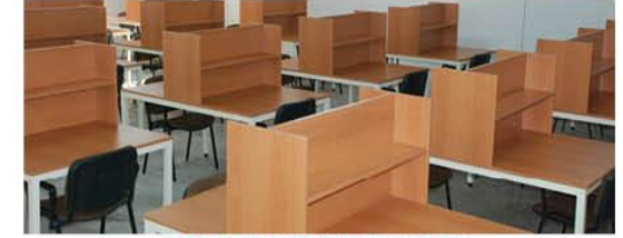
Resim 2 : 50 Kişilik Çalışma Salonu